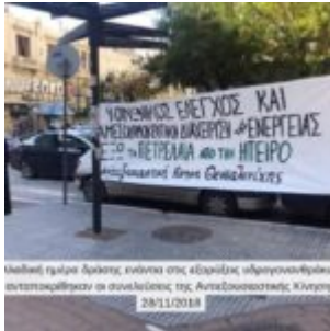
Μεγάλη ομάδα δράσης, ενάντια στις εξορύξεις υδρογονανθράκων ανταποκρίθηκαν οι συνολότητες της Απαιτούμενότητας Κίνησης 28/11/2018