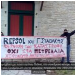
Πρόσβαση στην περιοχή της Αγίας Παύλου, από αναθεωρητικό κέντρο που είναι η επιμέλεια για τις εξορύξεις πετρελαιοί στις 23/01/2018 24/01/2018