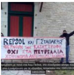
Παράσταση με πορνό στο Άνω Γαλάτσι, στο συνδυαστικό κέντρο που θα γίνει η επιμέλωση για τις εξορύξεις υδρογονανθράκων στις 23/01/2018 14/01/2018