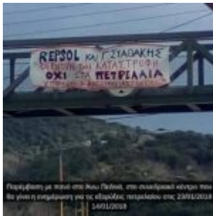
Παράσταση με πορνό στο Άνω Γαλάτσι, στο συνδυαστικό κέντρο που θα γίνει η επιμέλωση για τις εξορύξεις υδρογονανθράκων στις 23/01/2018 14/01/2018