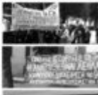
Μητροκομάρει για το ζήτημα των εξορύξεων 18/03/2023

Η Κοινωνία Αντιεξουσιαστική Κίνηση (ΚΑΚ) ανακοινώνει ότι θα πραγματοποιήσει μια σειρά από εκδηλώσεις και συλλογικές δράσεις με στόχο την ενημέρωση του κοινού για τα προβλήματα που δημιουργούνται από την εξόρυξη πετρελίου και αερίου στην Ελλάδα. Η ΚΑΚ θα πραγματοποιήσει μια σειρά από εκδηλώσεις και συλλογικές δράσεις με στόχο την ενημέρωση του κοινού για τα προβλήματα που δημιουργούνται από την εξόρυξη πετρελίου και αερίου στην Ελλάδα.