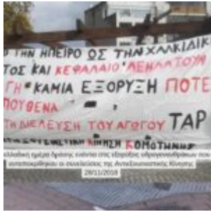
αδελφί ημάρι δράσεις ενάντια στις εξορύξεις υδρογονανθρακικών που αποκαταστάθηκαν οι συνθήκες της Αντιεξουσιαστικής Κίνησης 29/11/2018