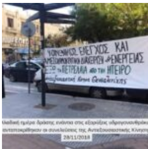
Μεγάλη ομάδα δράσης, ενάντια στις εξορύξεις υδρογονανθράκων ανταποκρίθηκαν σε συνειδησία της Αυτοοργανωτικής Κίνησης 28/11/2018