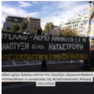
αδελφί ημάρι δράσεις ενάντια στις εξορύξεις υδρογονανθρακικών αποκαταστάθηκαν οι συνθήκες της Αντιεξουσιαστικής Κίνησης 20/11/2018