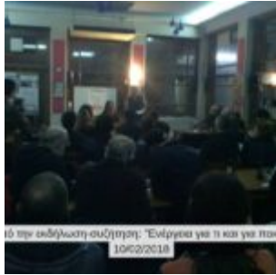
τό στη εκδήλωση συζήτησης. "Ενέργεια για ό,τι και για ποι 10/02/2018