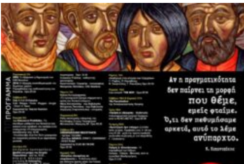
10 Χρόνια Nosotros Πολιτικό περιοδικό Βαβυλωνία