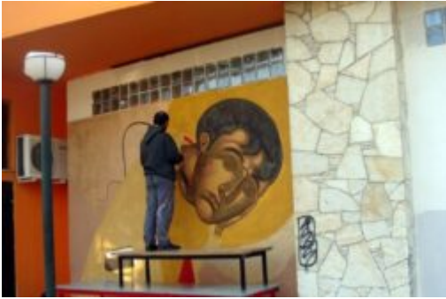
Κατάληψη Βοτανικός Κήπος Πετρούπολης

αφίσα του Ε.Κ.Χ. "Nosotros" για τον Δεκέμβρη του '08, όταν γκρεμίσαμε εμείς την αστυνομία. 3η : Η συμβολή του στα 10α γενέθλια του χώρου.