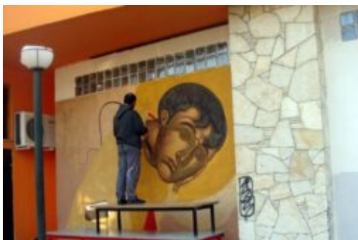
Κατάληψη Βοτανικός Κήπος Πετρούπολης

*Εικόνα 1η: Το έργο του στην πρώην κατάληψη του Βοτανικού Κήπου Πετρούπολης, στον τοίχο που γκρέμισε η αστυνομία 2η: Η αφίσα του Ε.Κ.Χ. "Nosotros" για τον Δεκέμβρη του '08, όταν γκρεμίσαμε εμείς την αστυνομία. 3η: Η συμβολή του στα 10α γενέθλια του χώρου.