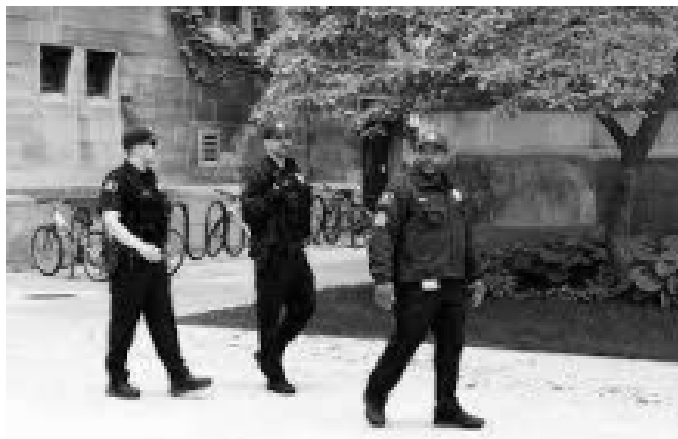
Αξιωματικοί της αστυνομίας του Πανεπιστημίου του Σικάγο στο κάμπους.

Τέλος, υπάρχει η αστυνόμευση. Ένα 75 τοις εκατό των σχολών έχουν πανεπιστημιακή αστυνομία. Σχεδόν όλοι φέρουν όπλα. Εννιά στους δέκα έχουν δικαιοδοσία σύλληψης και περιπολίας εκτός του κυρίως κάμπους. Ο ισχυρισμός είναι πως αυτή είναι μια επίδειξη της δημόσιας υπηρεσίας τους, η προθυμία τους να συνεισφέρουν για δημόσια ασφάλεια. Αλλά ας δούμε την πραγματικότητα της αστυνόμευσης του κάμπους. Τα μεγαλύτερα προβλήματα στα κάμπους είναι η σεξουαλική βία και η κατάχρηση ουσιών και η πανεπιστημιακή αστυνομία αποτυγχάνει παταγωδώς σε τέτοια εγκλήματα. Ποια σχολή θέλει να δημοσιοποιήσει πως έχει ένα κάμπους γεμάτο με λευκούς εγκληματίες; Αντ' αυτού, αστυνομεύουν τις περιμετρικές περιοχές γύρω από το κάμπους για να κατευνάσουν το άγχος των γονέων και των επενδυτών για την κυκλοφορία σε αυτές τις αστικές τοποθεσίες.