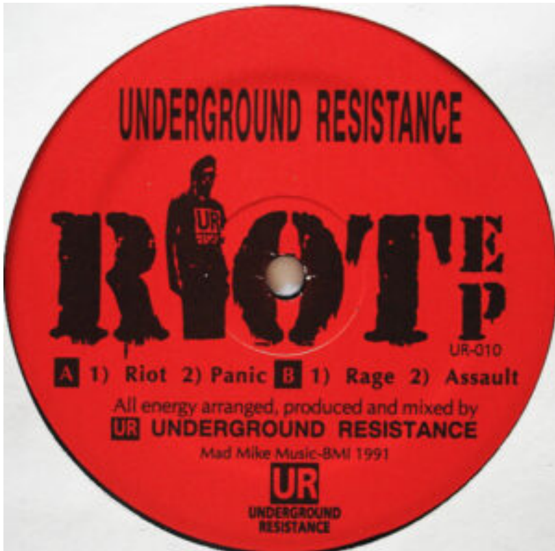
Underground Resistance – Riot EP, 1991