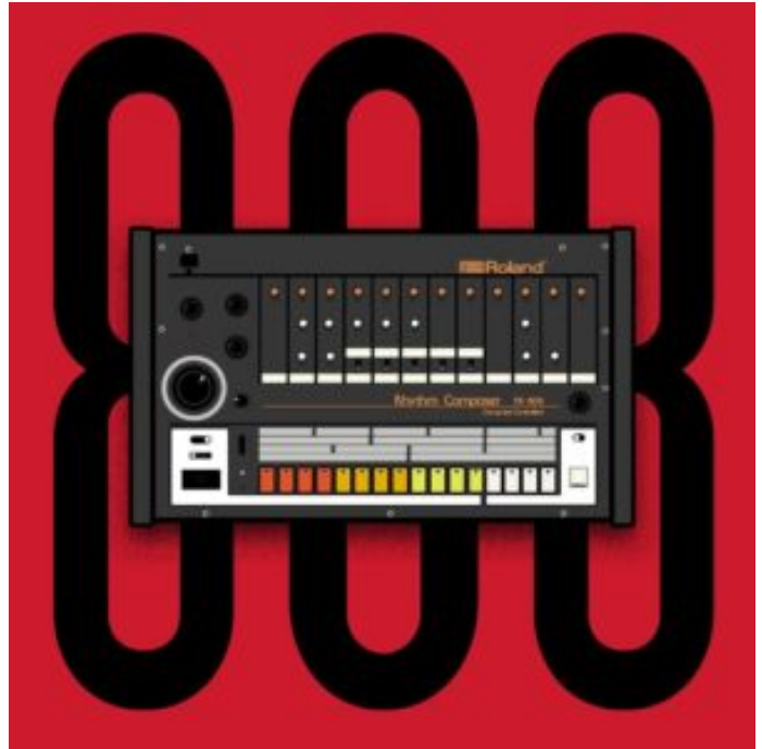
Roland TR-808 Drum Machine