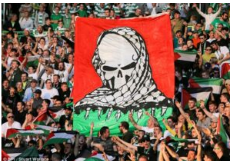
Οπαδοί της Celtic έντυσαν στα χρώματα της Παλαιστίνης το Celtic Park

Ας δούμε, όμως, το κατά πόσον όντως υπάρχει η «μη εμπλοκή με την πολιτική» που ευαγγελίζονται οι μεγάλες αθλητικές ομοσπονδίες. Είναι, βέβαια, οι ίδιες που τιμωρούσαν τη μη τήρηση της στάσης του «No Politics» με επιβολή προστίμων για την ανάρτηση αντιφασιστικών πανό από τους οπαδούς, και όχι μόνο. Χαρακτηριστικό είναι το παράδειγμα των οπαδών της Σέλτικ, ποδοσφαιρικής ομάδας της Σκωτίας, με σαφή πολιτικά χαρακτηριστικά, όταν σε ευρωπαϊκό αγώνα ποδοσφαίρου ανέβασαν πανό για τον πόλεμο στη Γάζα και την Παλαιστίνη. Τότε, η ποδοσφαιρική ομοσπονδία της ΟΥΕΦΑ τιμώρησε τον σύλλογο με την επιβολή προστίμου αξίας σαράντα χιλιάδων ευρώ, αφού, όπως αναφέρει η ίδια, απαγορεύεται η προώθηση πολιτικών μηνυμάτων στα γήπεδα.