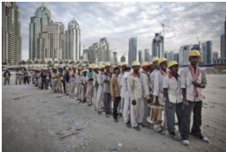
Εργάτες στα κάτεργα του Κατάρ για την προετοιμασία του Παγκοσμίου Κυπέλλου

Για να μη μιλήσουμε για τις αιματοβαμμένες διοργανώσεις στο Κατάρ και σε άλλες χώρες με πρόσχημα την επένδυση στο ποδόσφαιρο. Η μόνη επένδυση είναι το χρήμα. Οι ομοσπονδίες δεν νοιάστηκαν για τους νεκρούς εργάτες στον «δρόμο» για το Παγκόσμιο Κύπελλο Ποδοσφαίρου. Δεν νοιάστηκαν ούτε για όσα έγιναν στη Βραζιλία, ούτε στη Νότια Αφρική προηγουμένως. Όλα αυτά έχουν και είχαν άμεσες κοινωνικές προεκτάσεις και επιπτώσεις, ειδικά στο βιοτικό επίπεδο – στις φαβέλες, για παράδειγμα, όταν, αντί να γίνει κάτι για να αντιμετωπιστεί η εξαθλίωση των ανθρώπων, δαπανούνται τόσα δισεκατομμύρια για το χτίσιμο αθλητικών εγκαταστάσεων μόνο και μόνο για μία διοργάνωση.