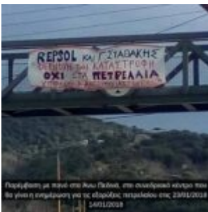
Παράσταση με πορεία στο Άνω Γαϊδάρο, στο ανατολικό κέντρο της πόλης για την ενημέρωση για τις εξορυκτικές πετρελαιοθήκες στις 23/01/2018