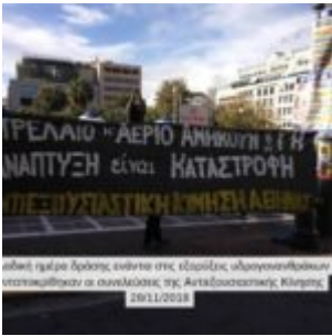
αδελφότητα δράσης ενάντια στις εβραϊκές υφρονομολογίες στα πλαίσια της Ανταξιαστικής Κίνησης 28/11/2018