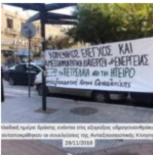
Μεγάλη πορεία διαμαρτυρίας ενάντια στις εξορυκτικές αδρυγονοθήκες πραγματοποιήθηκε σε συνδιοργάνωση της Αποκεντρωμένης Κίνησης στις 28/11/2018