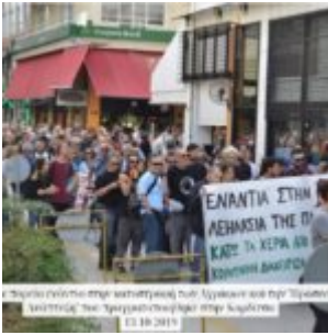
Επίσημο συνέδριο στην Αθήνα σχετικά με το ζήτημα που την Τρίτη και Τετάρτη των προγραμματισμένων στην Κάρτα των Κερα 2019