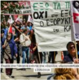
Εξορία στα Γιάννενα ενάντια στις εβραϊκές υφρονομολογίες 17/05/2018