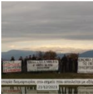
στοιχεία διαμαρτυρίας στο σταθμό που απειλείται με είσοδο 21/12/2023