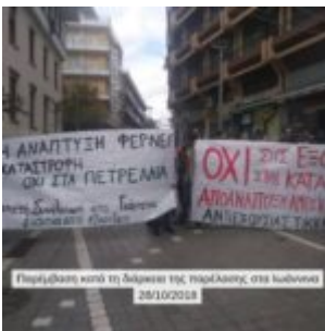
Παράσταση κατά τη διάρκεια της παράστασης, στα Γιάννενα 28/1/2018