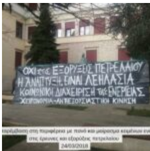
διαδήλωση στη χειρωνακτική με πλοία και μηχανήματα εργαζομένων στις βεντίνες και ελκυστές πετρελαιοειδών. 24/02/2018