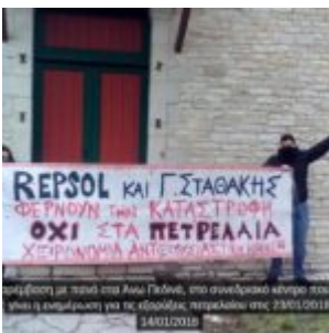
Παράσταση με πορεία στο Άνω Γαϊδάρο, στο ανατολικό κέντρο της πόλης για την ενημέρωση για τις εξορυκτικές πετρελαιοθήκες στις 23/01/2018