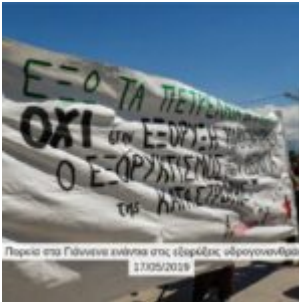
Πορεία στα Γιάννενα ενάντια στις εξορυκτικές αδρυγονοθήκες 17/05/2018