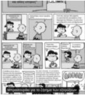
Μητροπολιτά για το όργανο των εφορειών