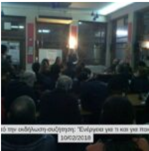
16 ημερήσια συνέλευση: "Ενέργεια για ό,τι και για ποιόν" 10/02/2018