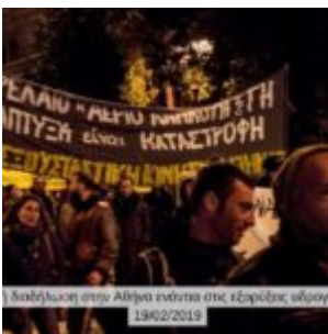
Παράσταση στην Αθήνα ενάντια στις εξορύξεις υδρογόνων 19/02/2019