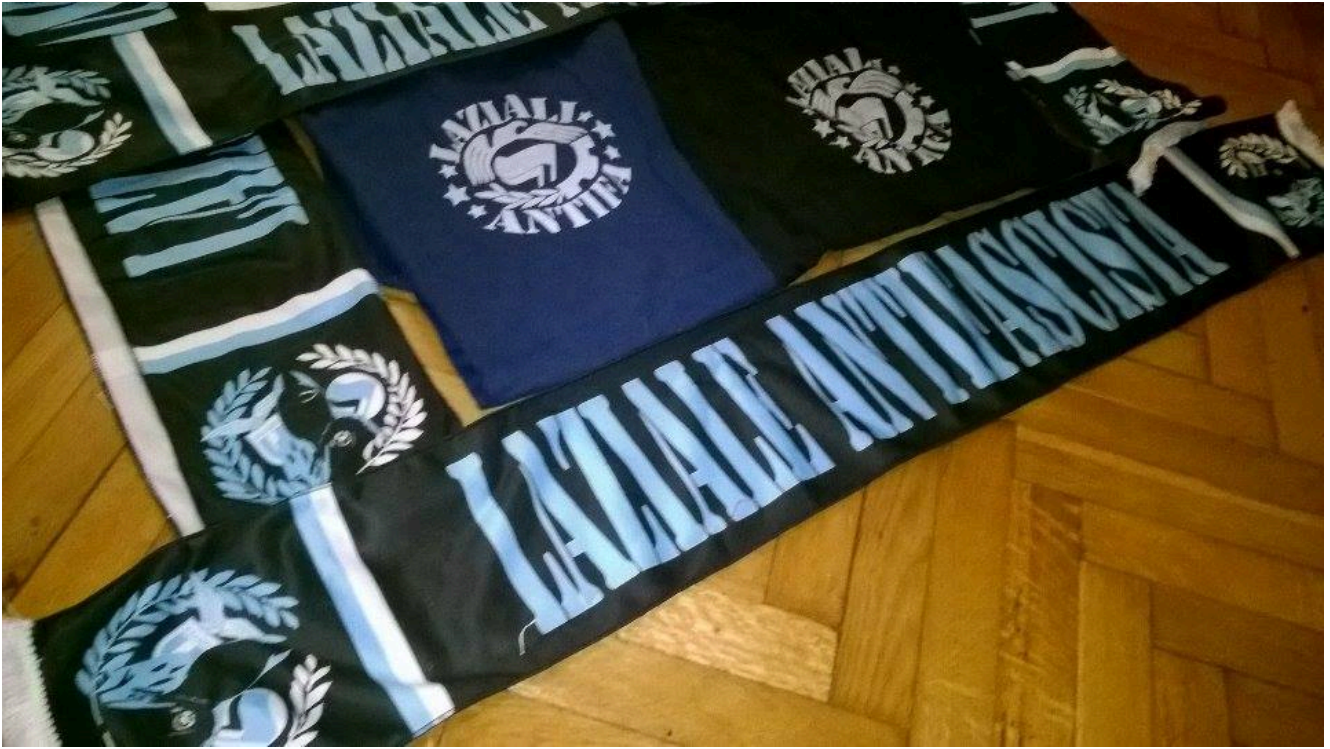
LAF scarves and t-shirts