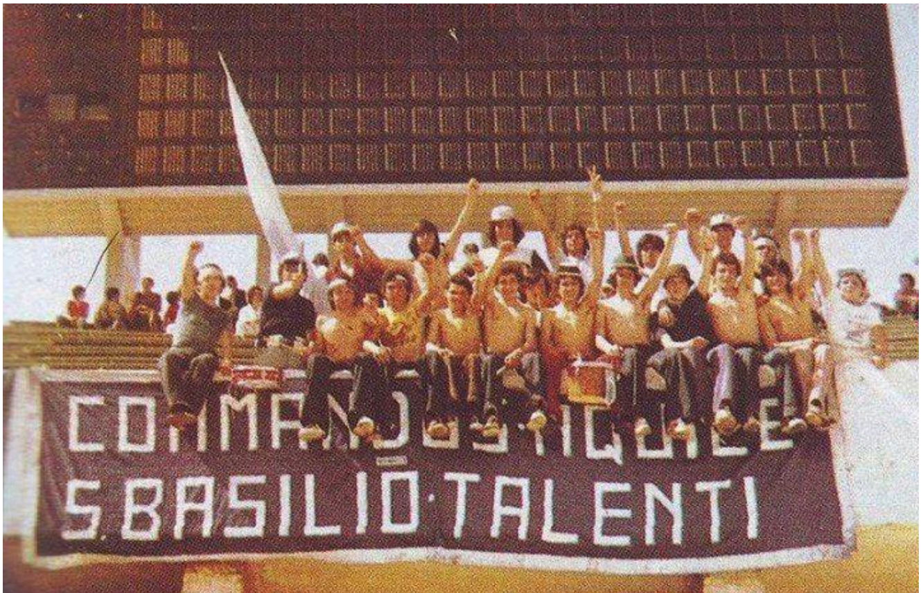
Photo of the left-wing Commandos Aquile S. Basilio Talenti (C.A.S.T.)

We are more involved with social movements than with political parties. In Rome there are many antagonistic realities, and our initiative being a movement with autonomous and independent cells is present in many of them. There is no single thought in the LAF, nor a political ideology. There are anarchists, communists, socialists, liberals: each active in their own private life, people united by anti-fascism and passion for Lazio.