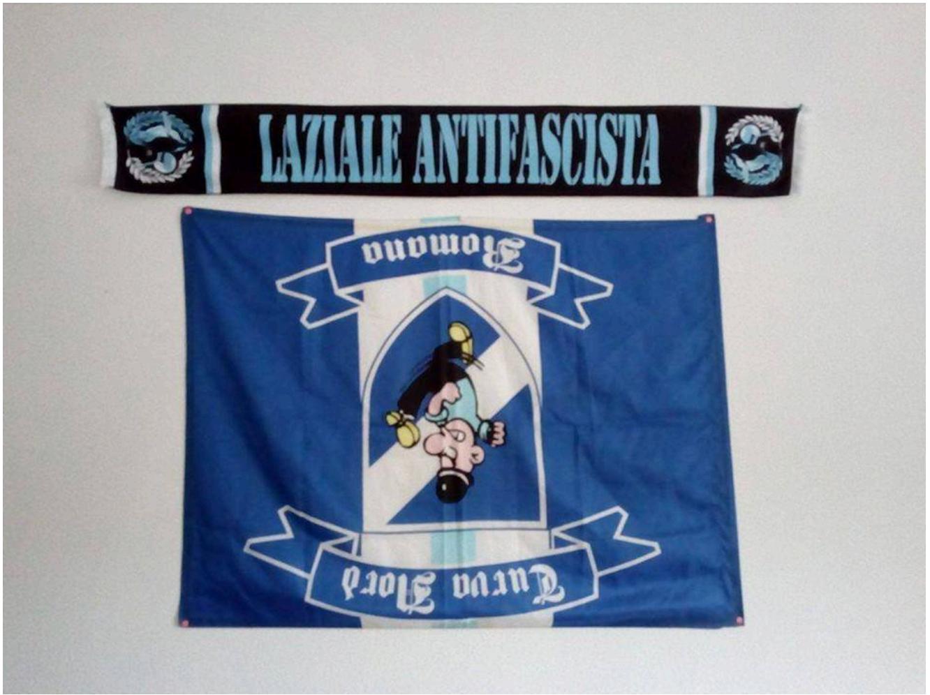
Flag of the far-right Irriducibili taken by LAF