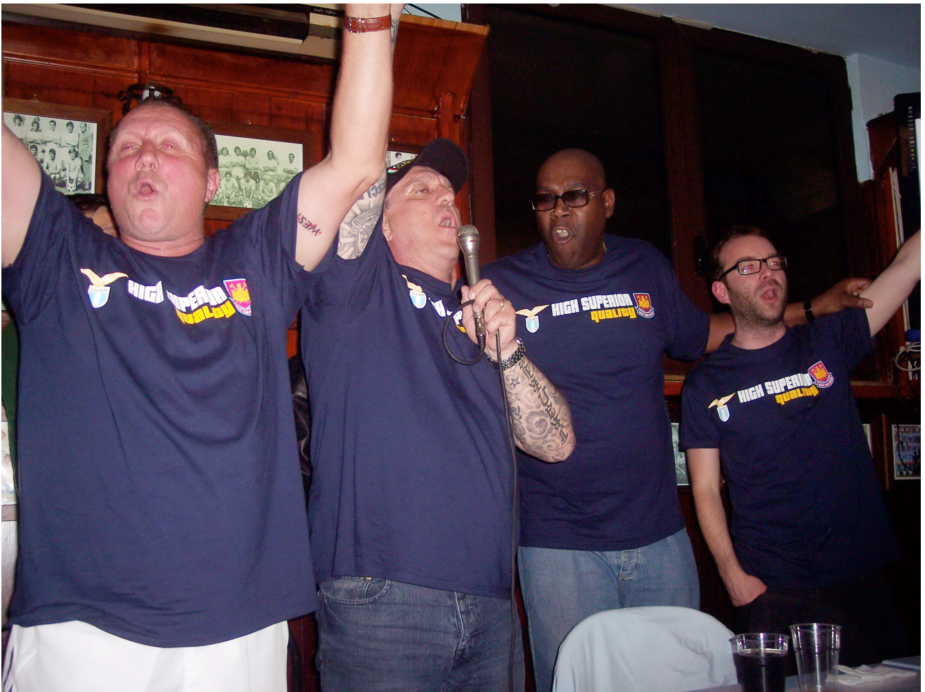
The recent close relationship with West Ham United has provoked much resentment among the far-right supporters of