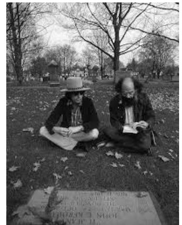
Ντύλαν και Γκίνσμπεργκ στον ταφο του Κέρουακ, 1975

Δεν είναι εύκολο να κατανοήσεις τους λαβυρίνθους του Ντύλαν. Αν θέλει κάποιος να ασχοληθεί με την περσόνα του, μπορεί να διαβάσει το βιβλίο του Robert Shelton No direction home –υπάρχει μόνο η αγγλική έκδοση– που φωτίζει την πολυσχιδή και ανήσυχη προσωπικότητά του. Σε αυτό το βιβλίο, μέσα από διαλόγους με τον συγγραφέα περί της ποιητικής ή μη των στίχων του, δεν αποδέχεται ότι είναι ποιητής. Εύγλωττα έχει πει: «Είμαι οι λέξεις μου».