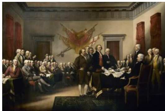
Η διακήρυξη της ανεξαρτησίας, έργο ζωγραφισμένο από τον Τζον Τράμπουλ

Τον Ιανουάριο του 1776 έχουμε την έκδοση της «Κοινής Λογικής» του Τόμας Πέην. Το κείμενο αυτό επηρέασε σε μεγάλο βαθμό τους επαναστάτες κάνοντας ξεκάθαρο ότι το αγγλικό πολίτευμα δεν μπορούσε με τίποτα να ταιριάξει με την έννοια της ελευθερίας. «Όσο κοντύτερα πλησιάζει μια κυβέρνηση στη Δημοκρατική πολιτική τόσο λιγότερη δουλειά έχει εκεί ο βασιλιάς», ισχυριζόταν ο Πέην, αναφέροντας ότι η τυραννία ήταν ενδημική στους βασιλιάδες. Ο Πέην έδωσε σκληρές απαντήσεις στη θεσμισμένη εξουσία τόσο του βασιλιά όσο και στην αυθεντία της Αγίας Γραφής και της ελέω θεού μοναρχίας. «Διότι η μοναρχία είναι από κάθε πλευρά ο παπισμός της διακυβέρνησης», διακήρυττε, και «καθώς όλοι οι άνθρωποι είναι αρχικά ίσοι, ένας δεν μπορεί να έχει κάποιο δικαίωμα εκ γενετής να θέσει την οικογένειά του σε προνομιούχα θέση σε σχέση με τους άλλους». Οι ελευθερίες, κατά τον Πέην, οφείλονταν στο πολίτευμα του λαού κι όχι της κυβέρνησης ενώ καλούσε την Αμερική να υιοθετήσει τη δημοκρατία ως διακυβέρνηση – ένα σώμα αντιπροσώπων χωρίς βασιλιά ή αριστοκρατία ενώ τα δεκατρία νέα κράτη έπρεπε να υιοθετήσουν συντάγματα που θα θέσπιζαν ενιαίες συνελεύσεις σε μία μόνο Βουλή.