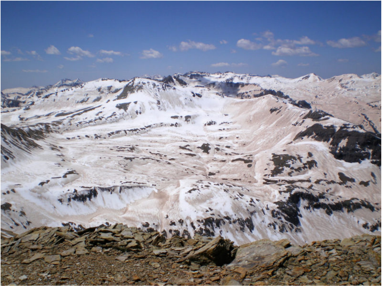
Σκόνη στο χιόνι στο όρος San Juan, Colorado

Τα σύννεφα σκόνης και τα σωματίδια αερολύματος που περιέχουν, έχουν σημαντικές επιπτώσεις στο κλίμα με άλλους τρόπους, όπως η παρεμπόδιση του ηλιακού φωτός που κατευθύνεται προς τη Γη. Όμως αυτός ο τομέας έρευνας είναι νέος και περίπλοκος και σχετική επιστήμη δεν έχει αναπτυχθεί, προσθέτοντας αβεβαιότητα στα μελλοντικά κλιματικά μοντέλα. “Ο τρόπος με τον οποίο τα αερολύματα επηρεάζουν το κλίμα εξαρτάται από το μέγεθός τους, το χρώμα τους, το ύψος τους στην ατμόσφαιρα, πώς αλληλεπιδρούν με τους υδρατμούς”, δήλωσε ο Neff. “Τα αερολύματα είναι μια δύσκολη περιοχή έρευνας, επειδή μπορούν να ζεσταθούν ή να κρυώσουν ανάλογα με τη σύνθεση και τη θέση τους”.