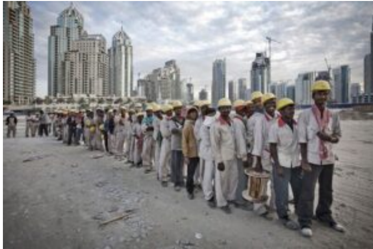
Εργάτες στα κάτεργα του Κατάρ για την προετοιμασία του Παγκοσμίου Κυπέλλου

Ο σύγχρονος αθλητισμός πάει χέρι χέρι με τις κρατικές αποφάσεις και, κατ' επέκταση, με τους γεωπολιτικούς ανταγωνισμούς. Όλα τα άλλα είναι προφάσεις στον βωμό του θεάματος και του κέρδους. Από το «Say no to racism», το «Black Lives Matter» μέχρι και τον ντόρο γύρω από τους Χειμερινούς Ολυμπιακούς Αγώνες του Πεκίνο.