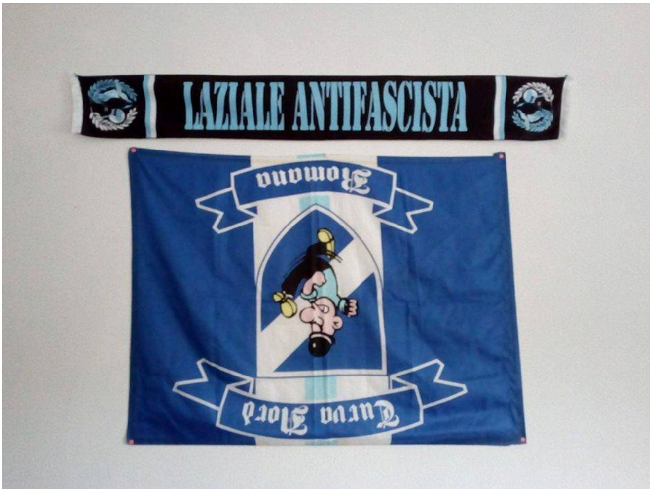
Σημαία των ακροδεξιών Irriducibili που πάρθηκε από τη LAF