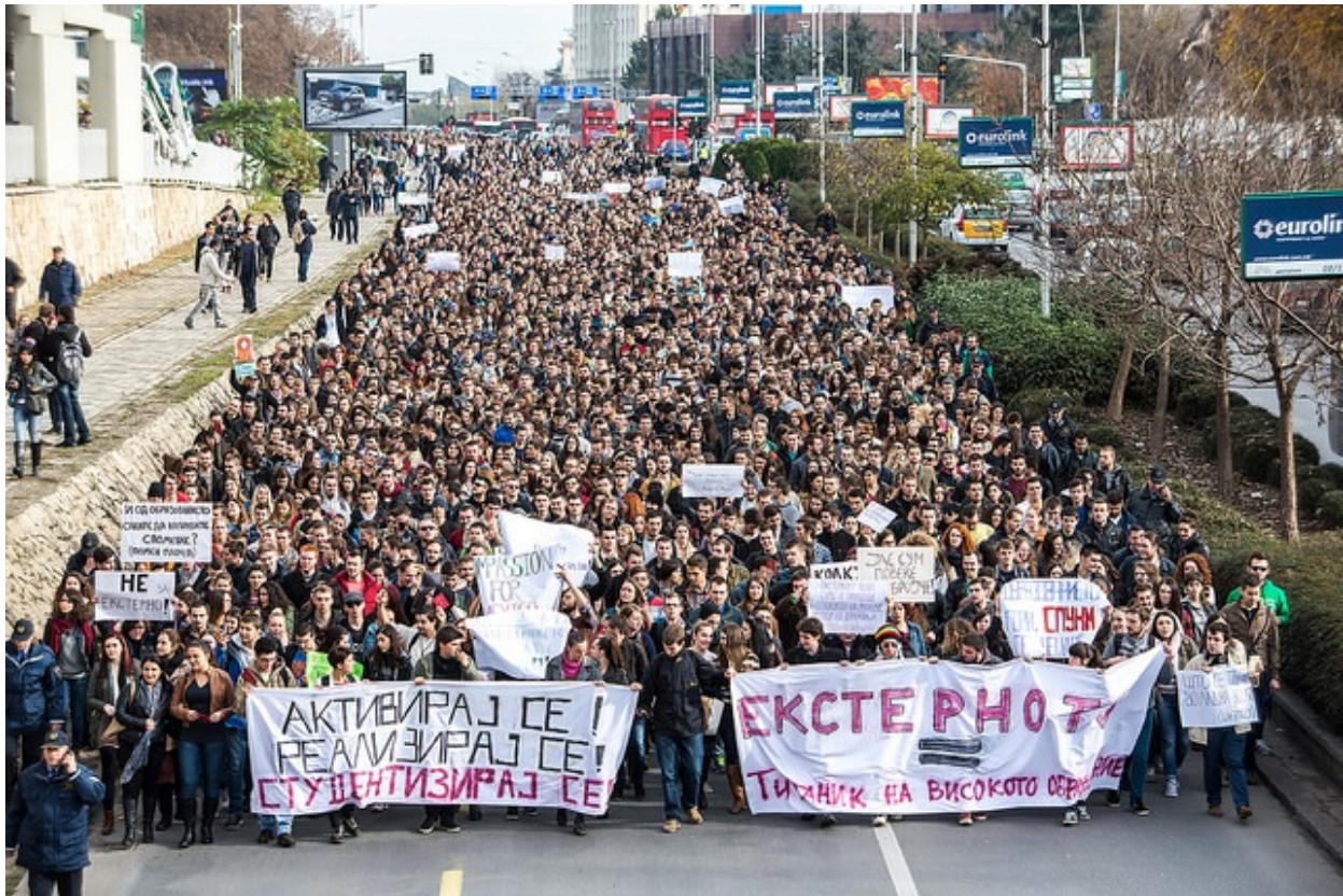
Φοιτητικές διαδηλώσεις 2014-2016.