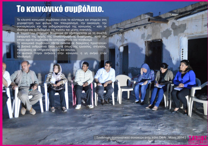
[ Συνάντηση συνταγματικού συμβουλίου στην πόλη Dénik, Μάιος 2014 ]

Το κλειστό κοινωνικό συμβόλαιο είναι το σύνταγμα και στοχεύει στη χειραφέτηση των φύλων, τον πλουραλισμό, την οικολογία, την εκκοσμίκευση και τον εκδημοκρατισμό της κοινωνίας – και το κλειστό για τα δίκαια, την ειρήνη και τις μέγιστες ανάγκες. Η παραπάνω στόχευση θεωρούμε ότι εκπληρώνεται με τη συνετή εφαρμογή της αρχής της αποκεντρωμένης διαχείρισης – κατά την οποία απλά συμβόλαιο θα εκπροσωπούν τον πληθυσμό. Το κοινωνικό συμβόλαιο τίθεται ενάντια σε διακρίσεις προσαρτάει τα βασικά ανθρώπινα δικαιώματα όπως της εργασίας, στέγης, πρόσβασης σε υπηρεσίες υγείας και ασφάλειας. Οι φυσικοί πόροι ανήκουν στην κοινωνία, η γη ανήκει στον πληθυσμό.