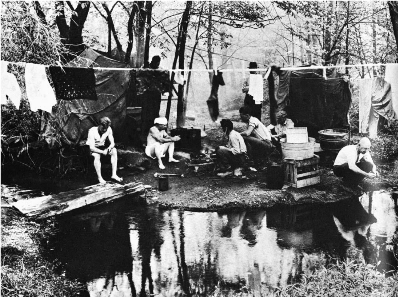
A Hobo Jungle

Vital part of these democracies was the institution of the jungle committees whose main task was the prescription of punishments as well as taking care of the everyday troubles in the camp.[21] Their members and chairman were voted between the inhabitants of these camps. Often the punishments they prescribed were viewed as too severe by the community, with the latter to offer alternative solutions.