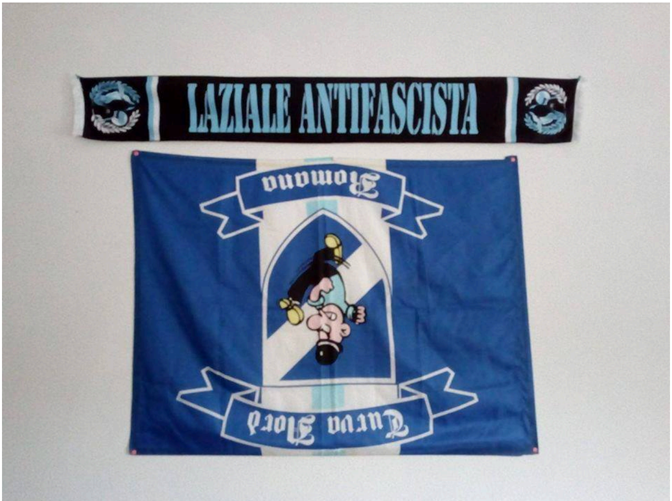
Flag of the far-right Irriducibili

The situation is so hard that we have to do what we do!