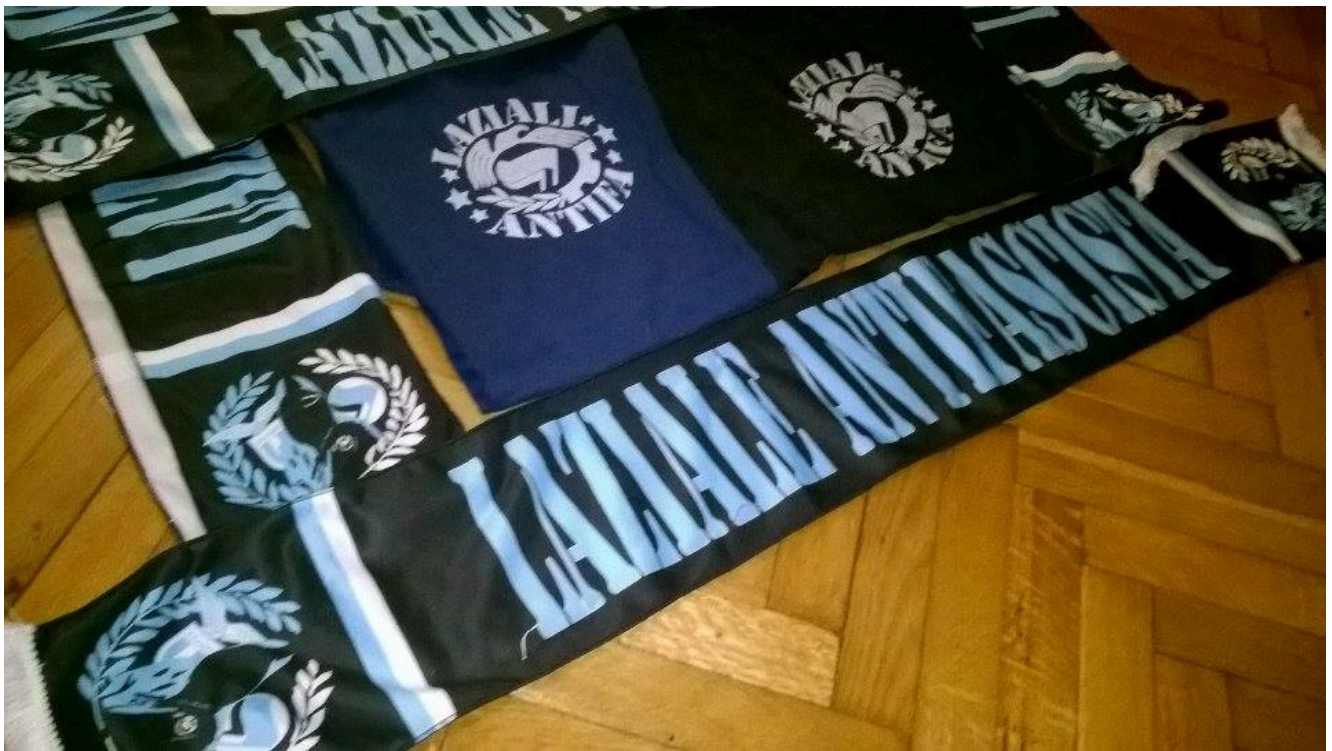
LAF scarves and t-shirts