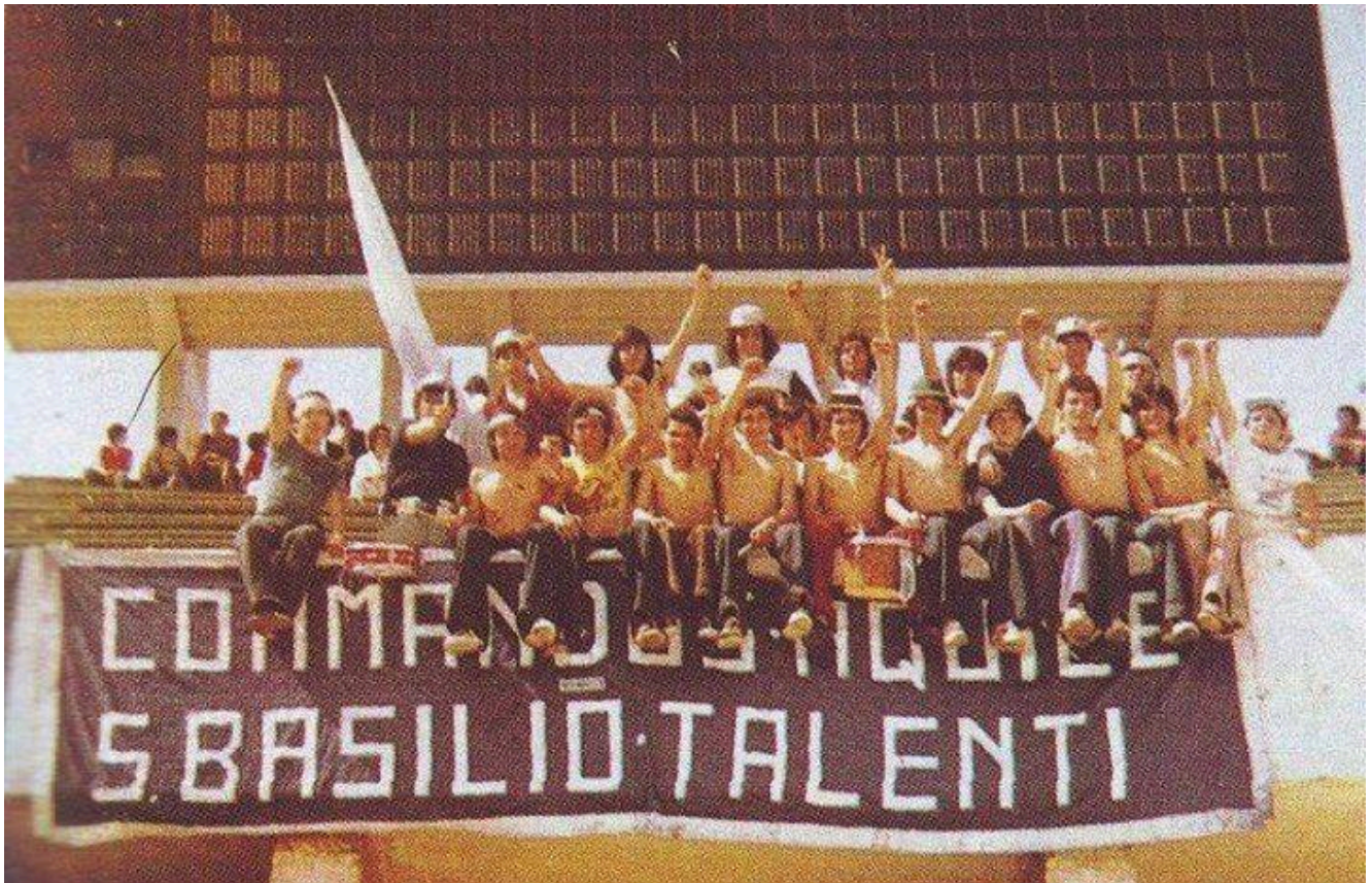
Photo of the left-wing Commandos Aquile S. Basilio Talenti (C.A.S.T.)

Can you give us a brief overview of the far-right influence in Italian football today?