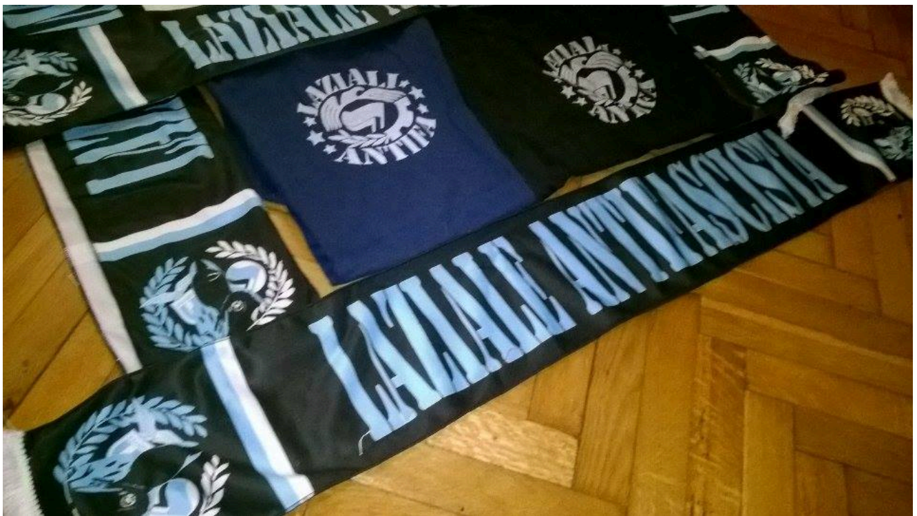
Κασκόλ & μπλούζες της LAF