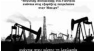
ενάντια στην φύση τη λεηλασία

συμπόρευση στο μέγεθος της "Αποστολής συνέλευσης στα Γιάννινα ενάντια στις εξορύξεις πετρελαιοειδών στην Ήπειρο"