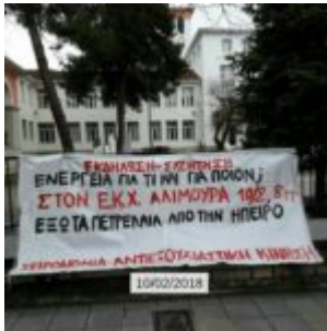
Χειρωνακία Αντιεστρατημική Κίνηση 10/02/2018