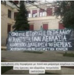
Παράσταση στη Πανεπιστήμιο με πάνω και μαρτυρία κερμάτων ενόπνια στις έρωτες και ερωτικές πετρελαιοί. 24/02/2018