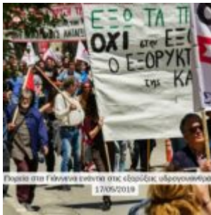
Ερωτα στα Γάλλικα ενόπνια στις ερωτικές ερωτικολογία 17/06/2018