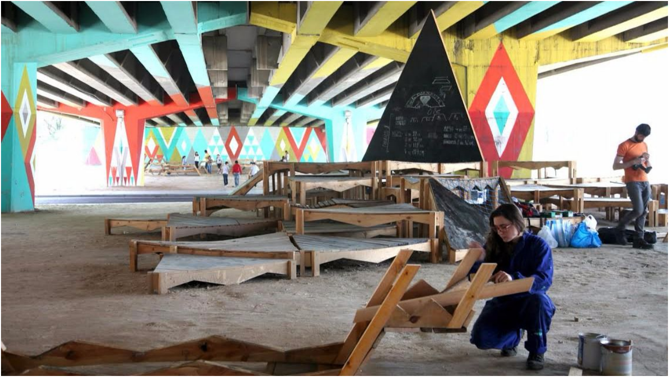
Autobarrrios San Cristóbal. Basurama

Ο αστικός σχεδιασμός ανοιχτού κώδικα δεν αποτελεί μία επιχείρηση παρά μία διαδικασία εγκαθίδρυσης των απαιτούμενων χώρων για την ανάπτυξη των κοινών. Αυτός είναι ένας από τους σκοπούς που έχουν οι συνεργατικές ψηφιακές πλατφόρμες οι οποίες μπορούν και ενώνουν διαφορετικούς κοινωνικούς κόσμους. Αυτές οι πλατφόρμες λειτουργούν ως το σημείο συνάντησης μεταξύ του «κρυμμένου» κόσμου των κατοίκων, των χρηστών, των χάκερς, των καλλιτεχνών και του «πάνω» κόσμου της διοίκησης, των επιχειρήσεων και των μηχανικών.