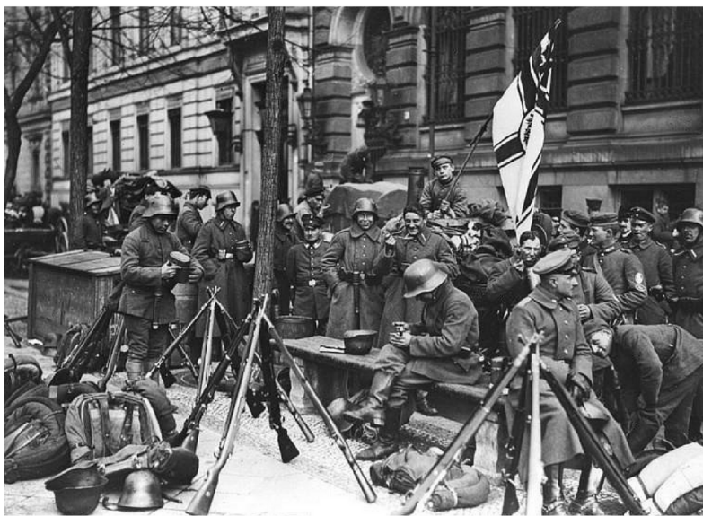
Freikorps: Το μακρύ χέρι του Γερμανικού Κράτους κατά την περίοδο 1918-1923

Κομισάριου για την «Διαφώτιση και την Δημόσια Καθοδήγηση». Δεν έμελλε ωστόσο να παραμείνει για καιρό σε αυτή την θέση. Λίγες ημέρες μετά την κυβέρνηση αναλαμβάνουν οι Κομμουνιστές οι οποίοι παύουν τον Λαντάουερ. Τίποτε από αυτά ωστόσο δεν είχε ιδιαίτερη σημασία. Την Πρωτομαγιά του 1919 τα Freikorps με τις ευλογίες των Σοσιαλδημοκρατών κάμπτουν την αντίσταση των υπερασπιστών της Δημοκρατίας και εισβάλλουν στο Μόναχο, προκαλώντας λουτρό αίματος. Ο Λαντάουερ συλλαμβάνεται και την επόμενη ημέρα δολοφονείται άγρια από τους τραμπούκους της ακροδεξιάς.