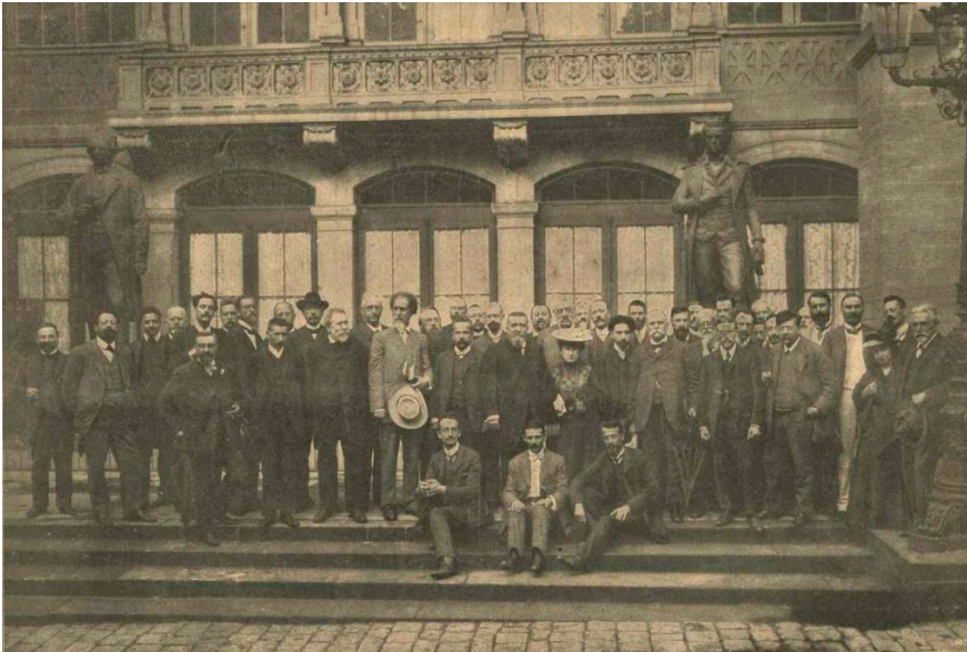
Στουτγκάρδη, 1907. Έβδομο Συνέδριο της Β' Διεθνούς.

Τα επεισόδια αυτά, μαζί με την ίδια την πολιτική πρακτική του SPD κατέστησαν τον Λαντάουερ εξαιρετικά καχύποπτο απέναντι στα Σοσιαλιστικά κόμματα και ανοιχτά εχθρικό προς την μαρξιστική ορθοδοξία, τον δογματισμό της οποίας θα κατήγγειλε σε κάθε ευκαιρία.