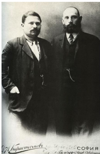
Ο Χρίστο Τσερνοπέεφ και ο Γιάνε Σαντάνσκι

Μετά τη συνθήκη του Βερολίνου, επόμενο γεγονός που οξύνει τις διαβαλκανικές σχέσεις, αποτελεί η πραξικοπηματική κατάληψη της Ανατολικής Ρωμυλίας το 1885, από βουλγαρικά στρατεύματα. Συχνά παρουσιάζονται βουλγαρικά αντάρτικα σώματα και στον μακεδονικό χώρο, όπου παράλληλα διεκδικεί εδάφη και η Σερβία αλλά και η Ελλάδα. Μετά το 1885 το μακεδονικό ζήτημα δημιουργεί σκληρό ανταγωνισμό.