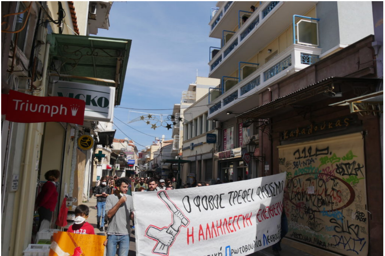
Αντιφασιστική Πορεία στη Λέσβο 14/3

Β: Στη νέα συνθήκη του προσφυγικού οι ΜΚΟ έχουν εξέχοντα ρόλο. Το συντριπτικό κομμάτι τόσο της κυρίαρχης πολιτικής σκηνής, όσο και του ανταγωνιστικού κινήματος είναι ενάντια στις ΜΚΟ. Γιατί δεν υπάρχει κεντρική διαχείριση; Γιατί δεν το αναλαμβάνει το κράτος, εφόσον «οι ΜΚΟ είναι διεφθαρμένες»;