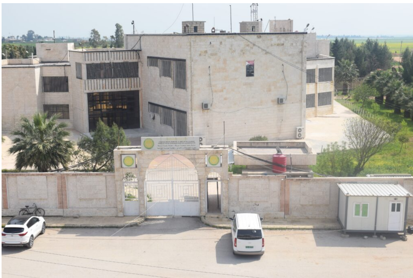
Πανεπιστημιούπολη του Καμισλί

Κάνουμε, συνεπώς, πολλά πράγματα! Αντιστεκόμαστε, ερευνούμε, αγωνιζόμαστε. Προσπαθούμε ιδιαίτερα να προσελκύσουμε καθηγητές από το εξωτερικό. Το πανεπιστήμιο μας είναι ένα εγχείρημα που είναι σε διαδικασία οικοδόμησης, ωστόσο εμείς πιστεύουμε σε αυτό! Πιστεύουμε πως μπορούμε να φτιάξουμε ένα άλλο σύστημα εκπαίδευσης που θα μπορεί να υπηρετεί ένα μοντέλο για όλη τη Συρία και την υπόλοιπη περιοχή. Τελευταία, το πανεπιστήμιο ξεκίνησε τηλεμαθήματα για να αντιμετωπίσει την επιδημία του κορονοϊού. Αυτό είναι κάτι πολύ καινούργιο για εμάς, ειδικά στο βαθμό που αντιμετωπίζουμε μια σειρά από τεχνικά προβλήματα, ωστόσο προσπαθούμε παρόλα αυτά να προσαρμοστούμε.