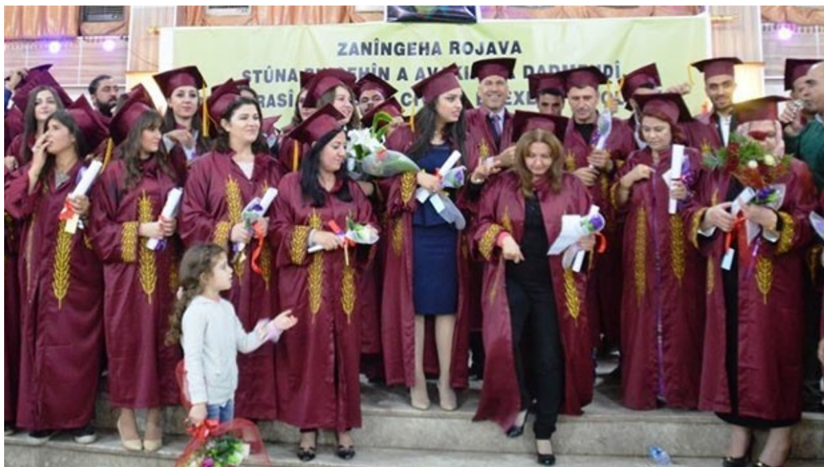
Τελετή απονομής πτυχίων, πανεπιστημιούπολη του Καμισλί

Με το πανεπιστήμιο, επιθυμούμε να σπάσουμε αυτόν τον αποκλεισμό, ακριβώς επειδή οι ιδέες έχουν την δύναμη να διαπερνούν τα σύνορα, ειδικά με την τεχνολογία που υπάρχει σήμερα. Αυτό είναι μια ευκαιρία να ανταλλάξουμε απόψεις, ακόμη και ένα δεν μπορούμε να φύγουμε από την επικράτεια. Το να συνομιλούμε με τα ξένα πανεπιστήμια μας επιτρέπει, επίσης, να διασφαλίσουμε την αναγνώριση του πανεπιστημίου μας διεθνώς. Όπως γνωρίζεις, το πολιτικό στάτους της περιοχής μας δεν έχει αναγνωρισθεί, ή τουλάχιστον όχι ακόμη. Κατά συνέπεια, το πανεπιστήμιο μας δεν είναι επίσημα αναγνωρισμένο ως τέτοιο. Αυτό αποτελεί ένα πραγματικό εμπόδιο για εμάς καθώς, για παράδειγμα, γνωρίζουμε πως υπάρχουν υποτροφίες, χρηματοδοτήσεις ή project στα οποία θα μπορούσαμε να υποβάλλουμε αίτηση ως πανεπιστήμιο αλλά, εφόσον δεν είμαστε έτσι αναγνωρισμένοι από τα άλλα διεθνή πανεπιστήμια και ιδρύματα, δεν μπορούμε να το κάνουμε.