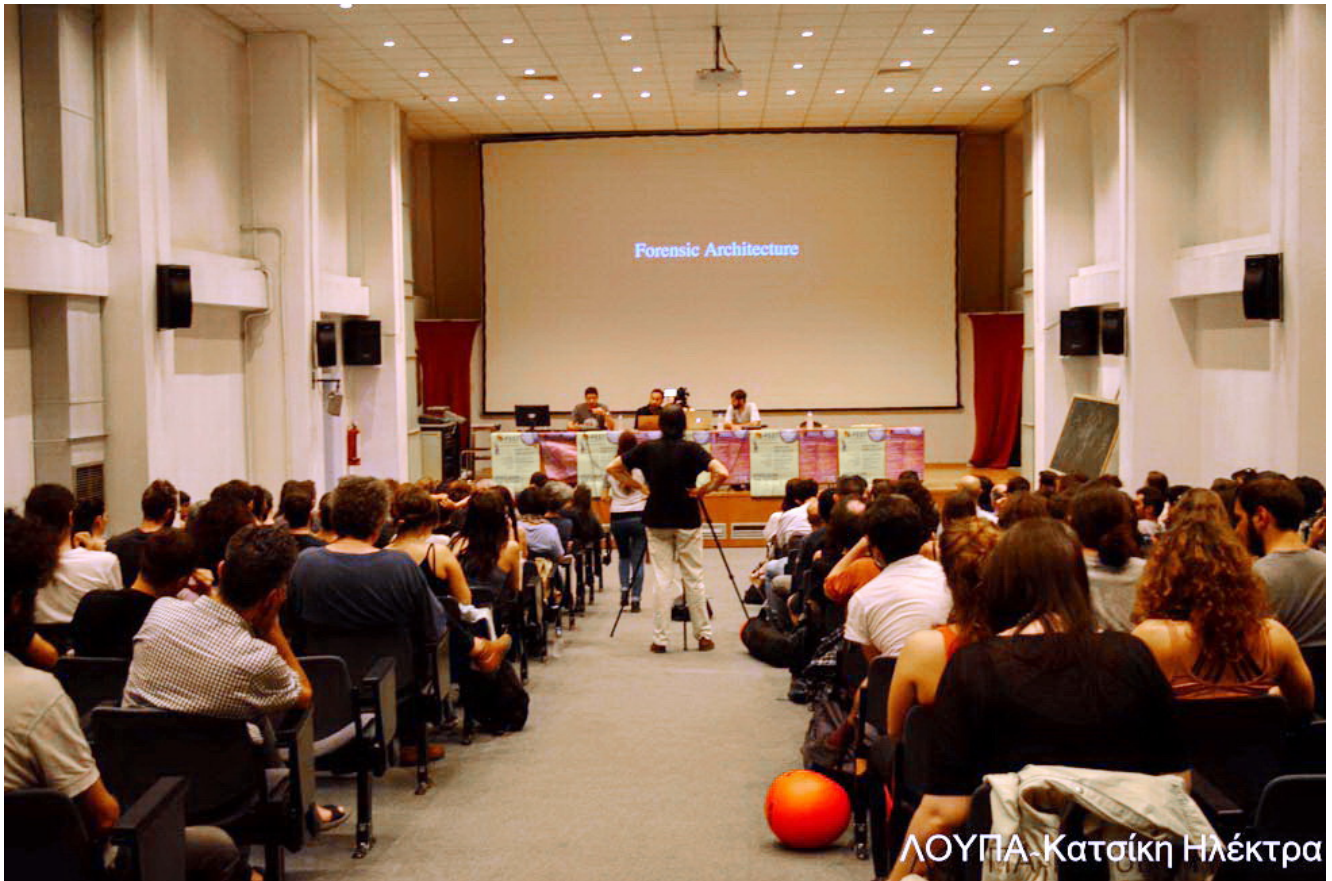
ΛΟΥΠΑ Κατσίκη Ηλέκτρα